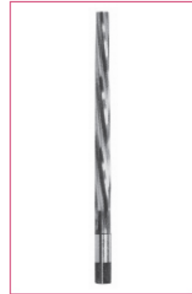
DIN 9 1/50 konik pim deliği raybası HSS Ø3 - 10 mm arası