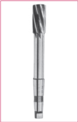
DIN 208 mors konik saplı makina raybası HSS Ø8 - 32 mm arası