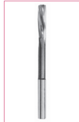
DIN 212 silindirik saplı makina raybası HSS Ø3 - 20 mm arası