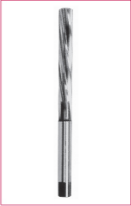
DIN 206 silindirik saplı el raybası HSS Ø3 - 20 mm arası